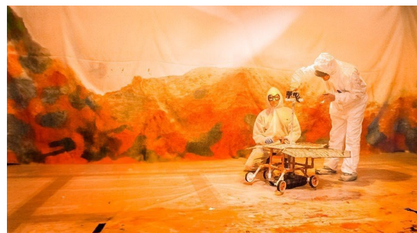
Galería AWOL - Swab Seed -

A més d'aquestes novetats, no faltaran programes habituals com el General , que inclou per primera vegada la subsecció " Emerging ", en la qual trobem galeries que ja