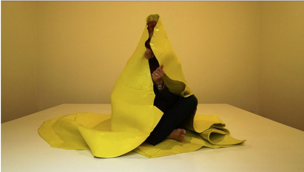
Galería Satélite, Querétaro. México en Femenino. Artista: Berta Koltieniuk.

La naturalesa transgressora de SWAB es tradueix en una programació que aposta per reflectir les problemàtiques socials i polítiques internacionals a través de les seves propostes. Totes les disciplines, des de les clàssiques com la pintura i l'escultura, fins a altres més actuals com l'art digital, performatiu o la instal·lació, són els mitjans utilitzats pels artistes per aconseguir canalitzar i connectar amb l'espectador. Aquest any, la majoria d'obres conviuen sota la recerca i el retorn a les arrels, en un camí que va des del primitiu al digital.