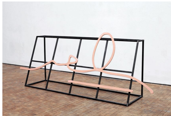
Galería The Switch. Artista; Hugo Cantegrel. Emerging

Como cada año, SWAB Kids será el espacio destinado al público infantil, un lugar donde la creatividad no tiene límites. Este año acogerá una propuesta artística que estimula los sentidos en colaboración con Fundación Ernesto Ventós . Com cada any, SWAB Kids serà l'espai destinat al públic infantil, un lloc on la creativitat no té límits. Aquest any acollirà una proposta artística que estimula els sentits en col·laboració amb la Fundació Ernesto Ventós .